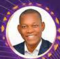
Laurent KAZADI Président Congo-Africa Business Council - RDC-