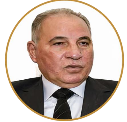
السيد الوزير / أحمد الزند النائب الأول لرئيس مجلس الأمناء