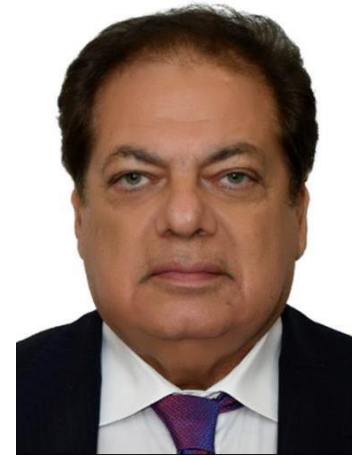
الأستاذ الدكتور / محمد أبو العينين نائب رئيس مركز كميت للتحكيم الدولي لشئون الاستثمار رجل الأعمال و وكيل مجلس النواب الرئيس الشرفي للبرلمان الأورو متوسطي