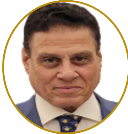
القاضي الجليل / محمد شرين نائب رئيس مجلس أمناء مركز كميت للتحكيم الدولي