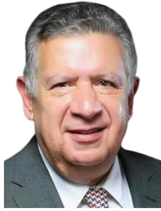
السيد الأستاذ / عمرو فؤاد كمال عضو المجلس أمناء مركز كميت للتحكيم الدولي رئيس البنك العقاري المصري الأسبق رئيس لجنة البنوك وأسواق المال وجمعية رجال الأعمال المصريين والأفارقة