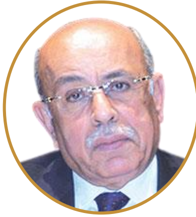
الأستاذ الدكتور مفيد شهاب رئيس جامعة القاهرة الأسبق وزير التعليم العالي الأسبق وزير المجالس النيابية والشئون القانونية الأسبق