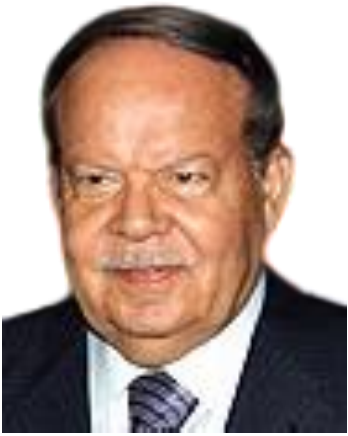
الأستاذ الدكتور / أحمد فتحي سرور رئيس مجلس الأمناء

وتكمن أهمية الرسالة التوعوية التي يسعى المركز إلى نشرها، والتي تشمل نشر ثقافة التحكيم المؤسسي، وإبراز أهمية التحكيم ودوره الفعال في حل النزاعات، وتأهيل كوادر من المحكمين ذوي كفاءة عالية في مجال التحكيم، من أجل نشر فكر التحكيم الدولي ورفع كفاءة المحكمين و تنبثق فلسفة التدريب في المركز من رؤية منهجية ترى في استثمار طاقات الكوادر البشرية فرصة لإكمال الأهلية القانونية والتحكيمية وزيادة المعرفة للقيام بمسئولية فض المنازعات التجارية والمالية والإستثمارية، من خلال جرعة عملية عن مفهوم وجوهر التحكيم وطبيعته وأنواعه ومراحله والتطور في الفكر القانوني التحكيمي.