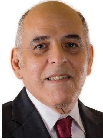
السيد المهندس / عبد الله غراب عضو مجلس أمناء مركز كميت للتحكيم الدولي وزير البترول الأسبق

سوف يتم تخصيص جلسة يومية لمدة ٤٥ دقيقة للتعرف على الواقع التطبيقي لعقود التحكيم و أهم التحديات العملية مع مجموعة من خبراء غير قانونيين لأثراء الجانب التطبيقي للمشاركين في المجال الاستثماري والرياضي وقطاع البترول.