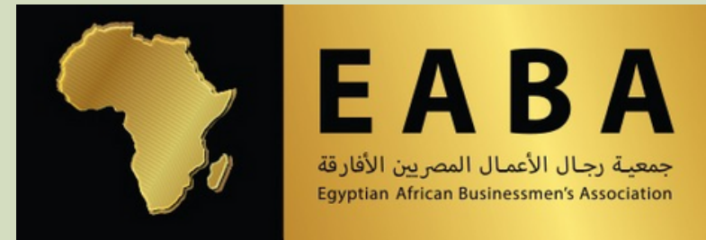
Egyptian-African Businessmen's Association